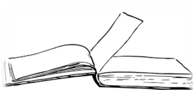
Registre des messes

Lorsque le prêtre célèbre plusieurs messes le même jour, il ne reçoit qu'une offrande.