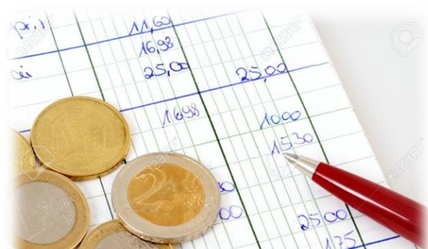
Une bonne tenue du livre de caisse facilite la saisie du comptable

Les paiements en espèces doivent rester exceptionnels, et en aucun cas être prélevés sur les recettes (quêtes...).