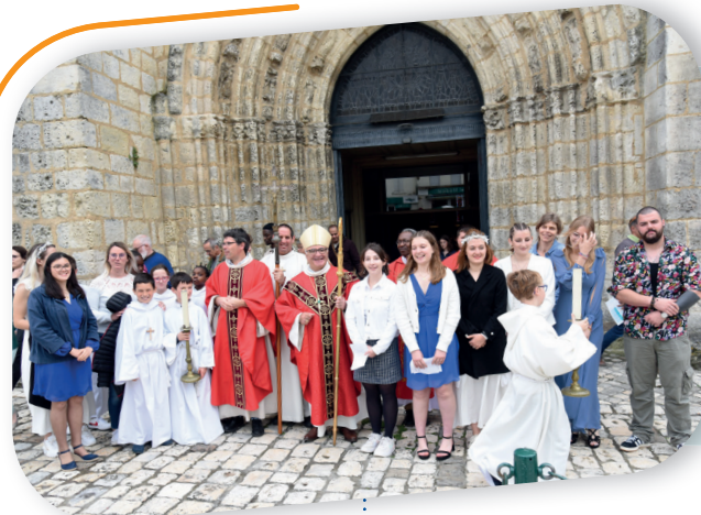
Mgr Gosselin à l'occasion de sa venue à Barbezieux le 5 mai 2024

On peut aussi prévoir des rencontres plus informelles : un temps de « permanence » pour rencontrer l'évêque ou l'évêque et les visiteurs.