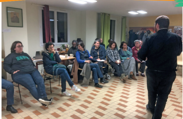
Assemblée locale à Barbezieux le 14 novembre