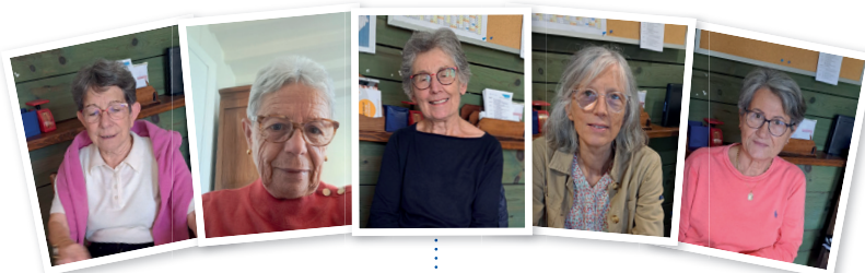
Quelques membres de l'équipe de Barbezieux