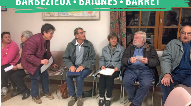
Assemblée locale à Baignes le 14 novembre 2024