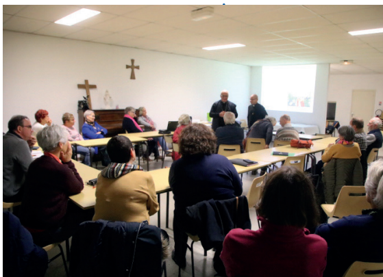
Mgr Gosselin lors de la visite pastorale à Montmoreau le 22 novembre