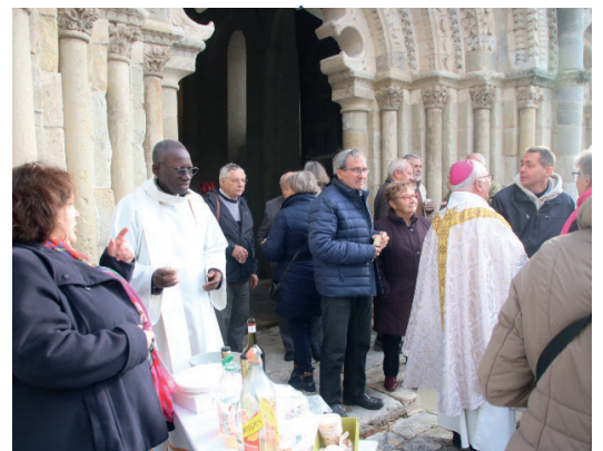
Verre d'amitié lors de la visite pastorale à Montmoreau le 24 novembre