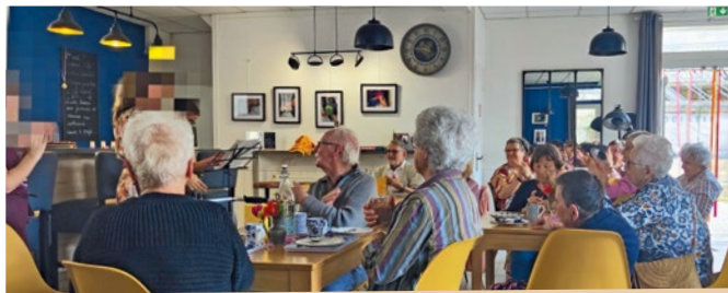
Animation au bar "Le fraternel" par 3 jeunes filles de 12 ans. pour prendre soin de nos aînés engagés ou non !

Elles nettoient, chantent, visitent, organisent, créent, font des bouquets, proposent, tiennent boutique, présentent des livres, écrivent, dessinent, portent vos prières et la communion, écoutent, partagent, assument des responsabilités, ouvrent les églises, travaillent en équipe, forment, conseillent, prennent soin des encore plus anciens... Les retraités sont devenus les actifs de nos communautés !