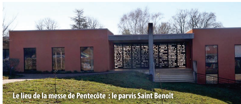
Le lieu de la messe de Pentecôte : le parvis Saint Benoît

Tout le doyenné rassemblé, avec la communauté des sœurs, pour célébrer la Pentecôte dans la diversité des vocations, des langues, des histoires, des parcours, des missions.