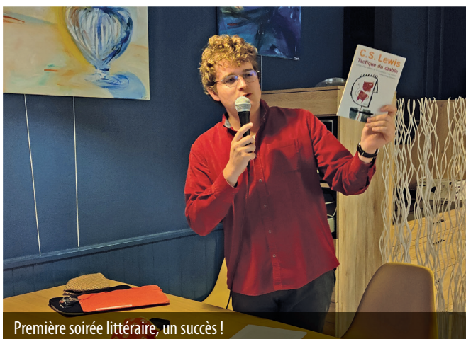
Première soirée littéraire, un succès !