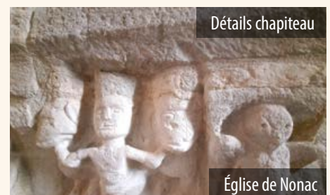
Église de Nonac

Le programme et toutes les informations pratiques à jour sur : www.charente.catholique.fr/sud-charente/agenda/la-nuit-des-eglises/