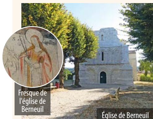
Église de Berneuil