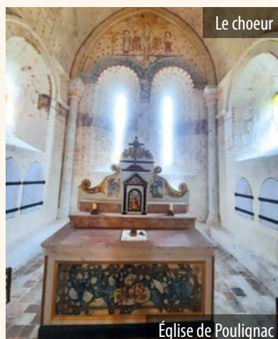
Église de Poullignac