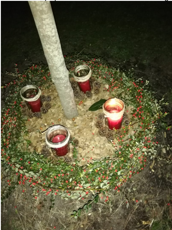
Couronne de l'Avent en extérieur

ses enfants qui passent devant chez nous. En signe d'espoir pour les temps difficiles que nous vivons.