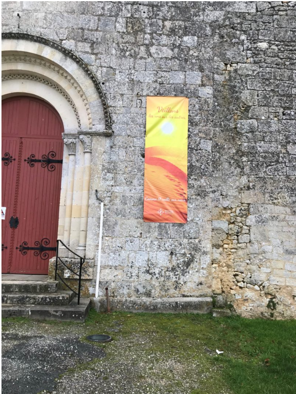
Eglise de Baignes