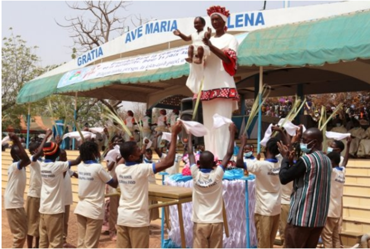
Cérémonie de consécration du Burkina Faso à la Vierge de Yagma

il a également insisté sur l'engagement et la participation des laïcs à la politique dans un esprit de service « engagez-vous dans la recherche du bien communautaire et dans un esprit de service, dans le respect des réalités terrestres et dans la promotion du dialogue puis dans la perspective de la solidarité. »