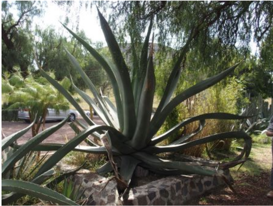
Plante comme celle qui a servi à tisser la tilma

Arrêt à la place des Trois Cultures, aménagée sur l'ancienne place principale de la cité de Tlatelolco. Cette place doit son nom à la réunion symbolique des trois principales cultures qui fondent la nation Mexicaine : une église coloniale, des ruines aztèques et un immeuble moderne.