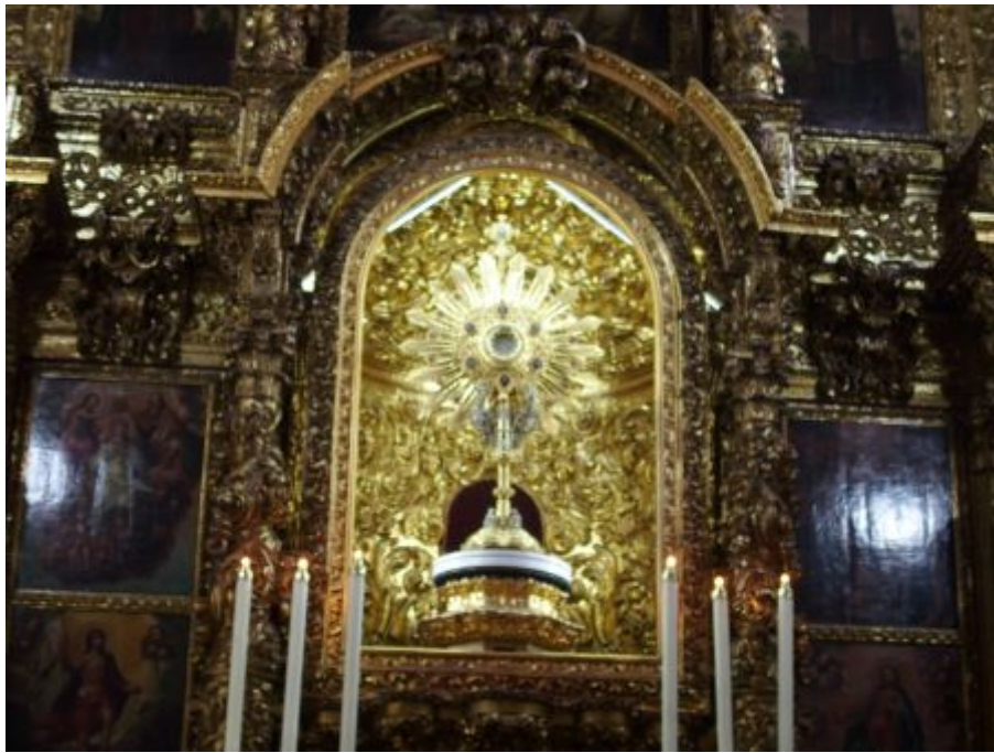
La messe quotidienne est célébrée chez les frères de saint Jean.