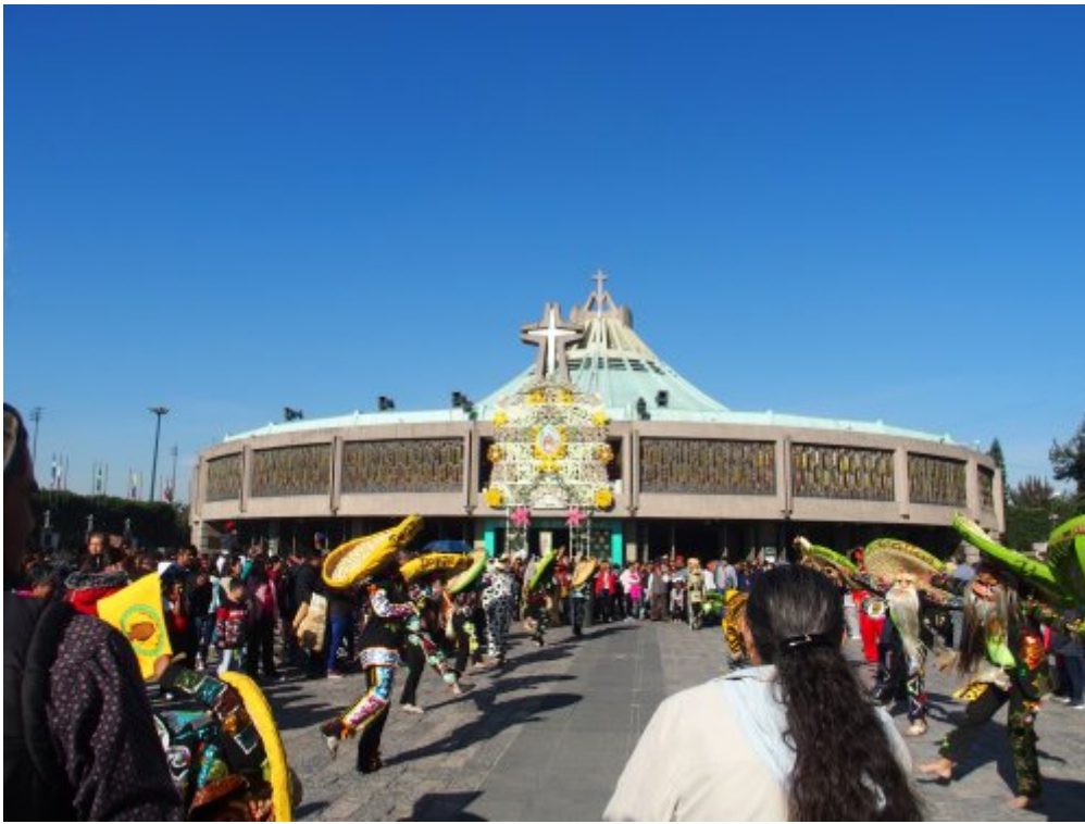
La foule sur le parvis de la basilique

Son portrait s'est imprimé sur sa Tilma , manteau traditionnel mexicain qui se portait noué autour du cou ; ce vêtement est exposé dans la nouvelle basilique. L'ancienne basilique a été transformée en musée.