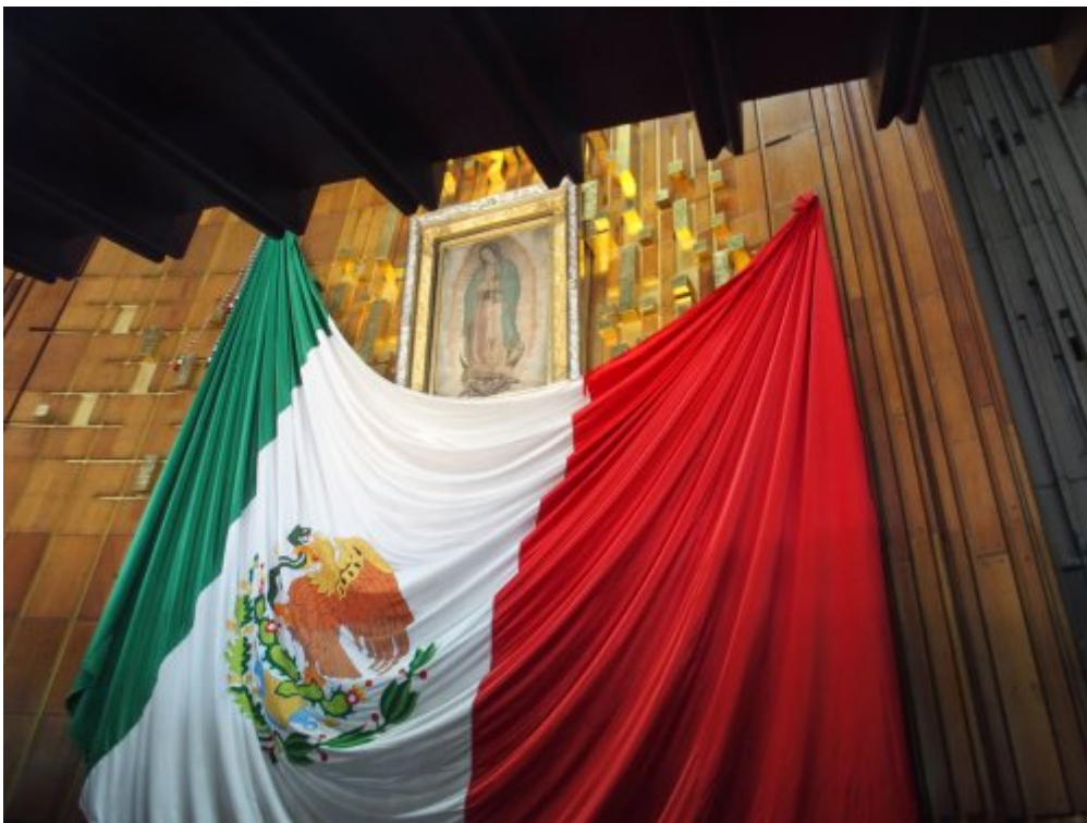
La Tilma exposée dans la basilique

Son portrait s'est imprimé sur sa Tilma , manteau traditionnel mexicain qui se portait noué autour du cou ; ce vêtement est exposé dans la nouvelle basilique. L'ancienne basilique a été transformée en musée.