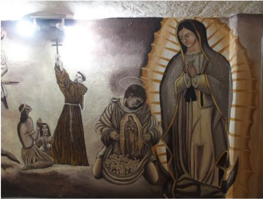
Visite de la maison d'habitation du saint avec évocation de son parcours de vie.