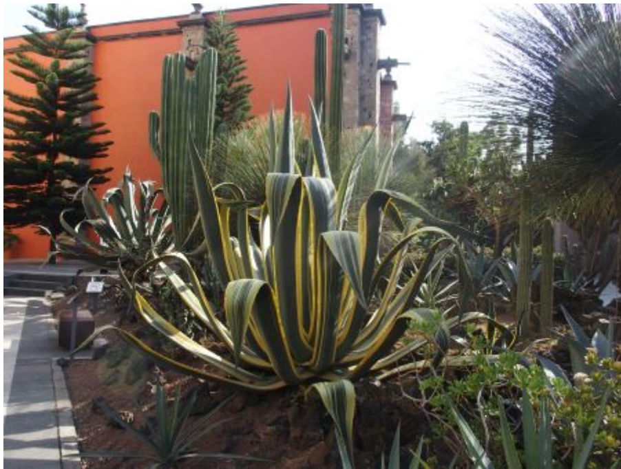
Végétation au Mexique

Puis, visite du séminaire jésuite qui est aujourd'hui le Musée national du vice-roi et qui abrite des centaines de trésors de l'art colonial. vegetation_au_mexique