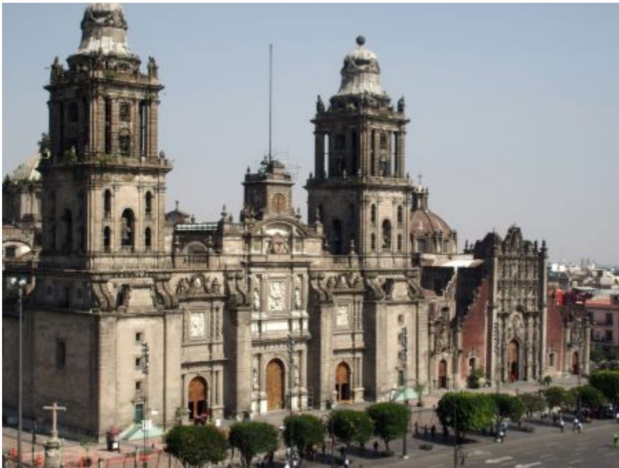
La cathédrale de Mexico

De retour à MEXICO nous avons découvert la cathédrale, édifice religieux le plus important du continent, érigée à partir de 1537. Les cinq nefs abritent de nombreuses chapelles aux noms symboliques. Puis nous avons visité le centre de la ville.