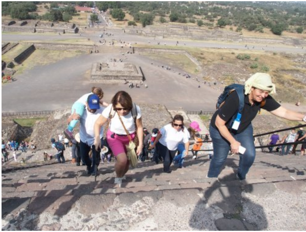
Montée de la pyramide

Visite du monastère d'ALCOMAN, l'un des premiers fondés par l'ordre des Augustins. Nous avons pu assister là à un baptême d'adulte dans ce monastère où nous avons célébré la messe. Cérémonie très colorée et joyeuse . Après la messe nous avons rencontré la communauté catholique française à Mexico.