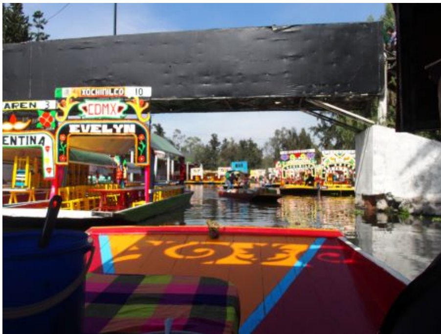
Sur la barque