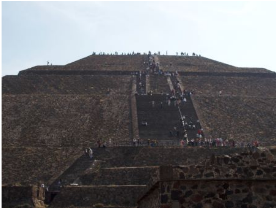
Pyramide du soleil

Visite du site de Teotihuacan, qui signifie dans la mythologie mexicaine "Lieux où les dieux sont nés". Ce site est le plus important de l'époque classique (du IIIe au IXe siècle) et marque le début d'un nouveau type d'urbanisme qui va se perpétuer jusqu'au Mexico d'aujourd'hui. Ce site est un mystérieux vestige archéologique qui inspira de nombreuses légendes. Lors de cette découverte nous empruntons la célèbre allée des morts, longue de 4 kms, où s'alignent de part et d'autre, la pyramide de la Lune et celle du soleil, deux figures bien connues de la Maison Diocésaine. Les aumôniers de la maison d'arrêt d'Angoulême prennent l'air et grimpent courageusement ; il est vrai que les tickets de repas sont distribués en haut de la Pyramide du Soleil.