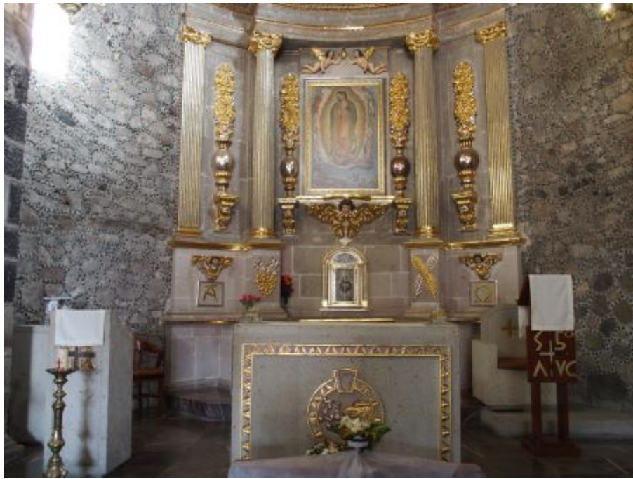
La chapelle où nous avons célébré la messe

Visite de l'église San Francisco Javier, l'un des meilleurs exemples du style baroque.