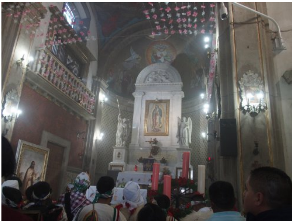
Chapelle sur le lieu des apparitions

Nous avons visité la première chapelle construite sur le mont Tepeyac, puis célébré la messe dominicale au sanctuaire.