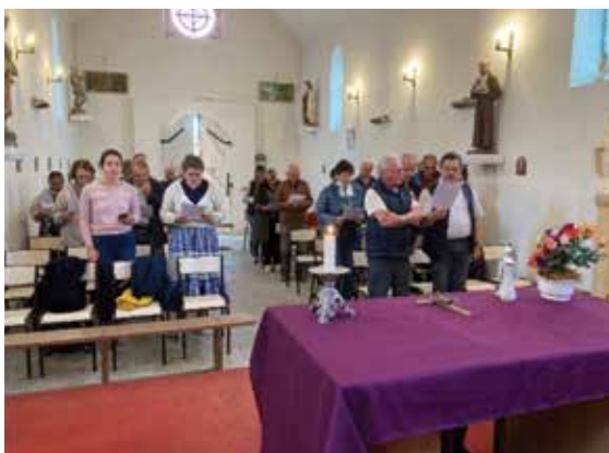
Laudes à la chapelle de Luchac