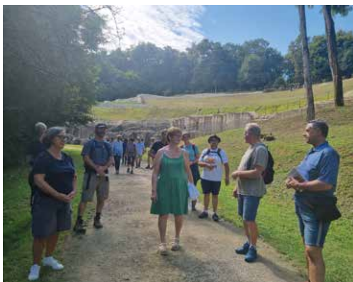
Après le pique-nique, occasion de partager nos délicieuses victuailles, nous suivons la guide conférencière pour la visite du centre d'interprétation. Une plongée passionnante dans l'époque gallo-romaine.

Puis en route pour l'église de Saint-Cybardeaux... Il y sera question de temps et non plus d'époque. Nous prions : « Je vais prendre le temps de poser mon regard sur les choses de tous les jours et les voir autrement. »