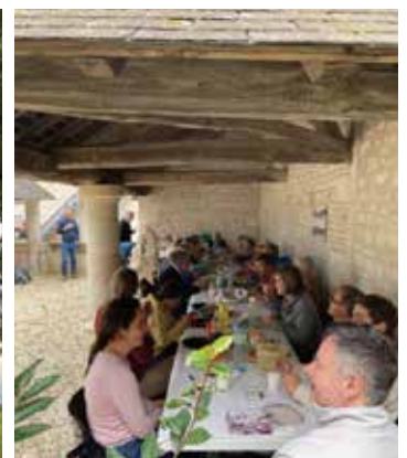
Déjeuner sous le préau à Julienne