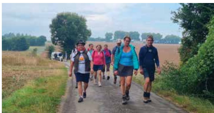
Nos pas nous mènent aux Bouchauds... Montée vers le sanctuaire gallo-romain