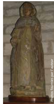
Statue de Saint-Benoît (Souillac)

Nicole Fournier, rédacteur JP, guide bénévole, abbatiale de Souillac (46).