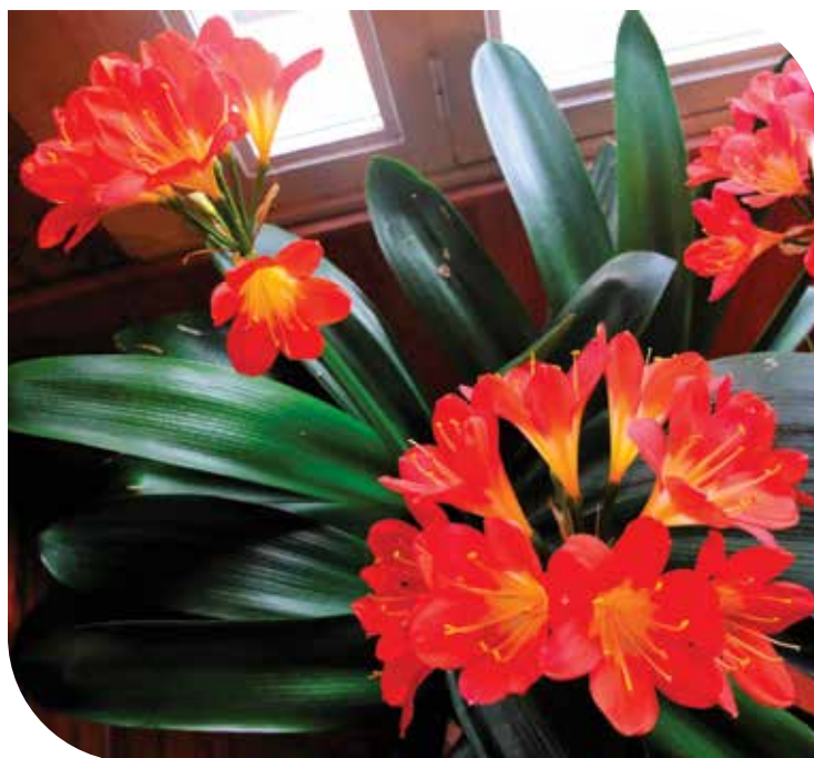
Le « clivia de la saint Joseph » aussi appelé le lys de saint Joseph car il fleurit en mars. M.-C. Queyreur