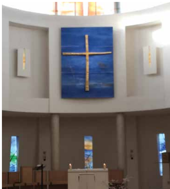
Eglise des Bénédictines de Notre-Dame du Calvaire, Bouzy la Forêt (45)

Au cœur de chaque paroisse, la célébration de la Passion et l'adoration de la Croix doivent rassembler plus encore et mieux encore pour nous préparer à l'irruption de la joie pascale dans le silence du tombeau.