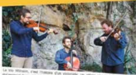
Le trio Wilhelm, c'est Thomas d'un violoncelle, un alto et un violoniste qui se rencontrent dans un bar... et qui jouent ensemble depuis.