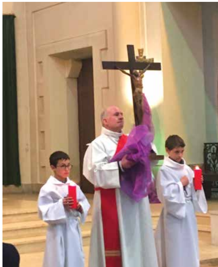
Office de la Passion, Limoges (2023)

Après le rite de la Croix, la communion est offerte à l'assemblée avec le pain eucharistique de la célébration de la Cène (Jeudi Saint) de la veille. En effet, c'est l'Eucharistie, sacrement pascale par excellence, qui assure ainsi l'unité de la liturgie qui va de la Cène à la Vigile au-delà du silence du Samedi Saint.