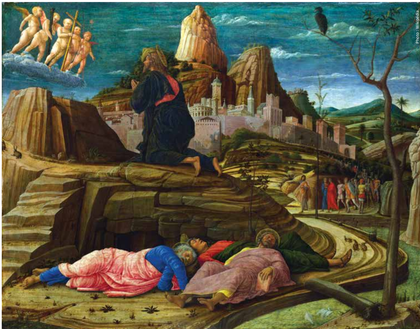
Andrea Mantegna : l'Agonie dans le Jardin (vers 1458-1460)

"Face à l'échec de la mort imminente, Jésus exprime son désir profond de ne pas mourir"