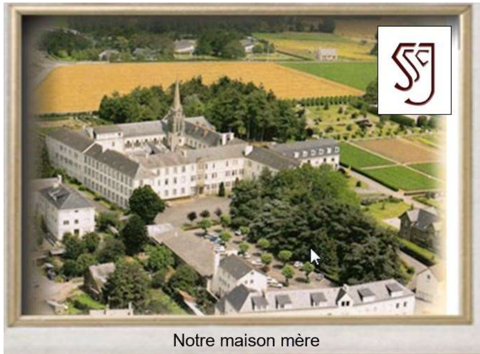
Notre maison mère