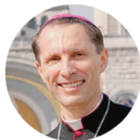
Mgr Brocard Evêque de Strasbourg