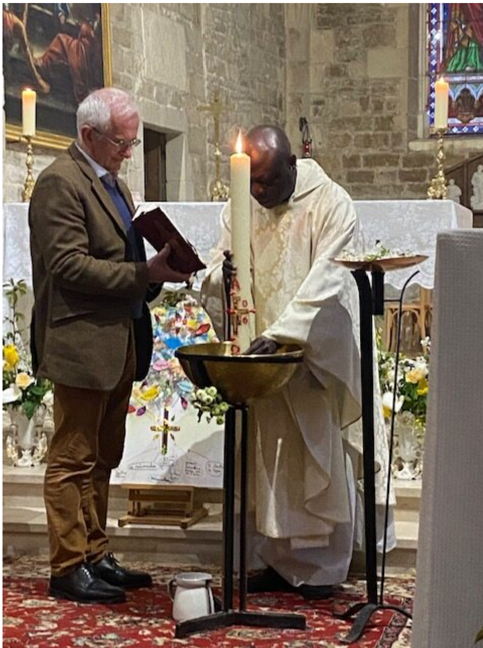
Dans une église désormais pleinement illuminée, la célébration s'est achevée dans la joie de Pâques, portée par les chants et la prière commune.