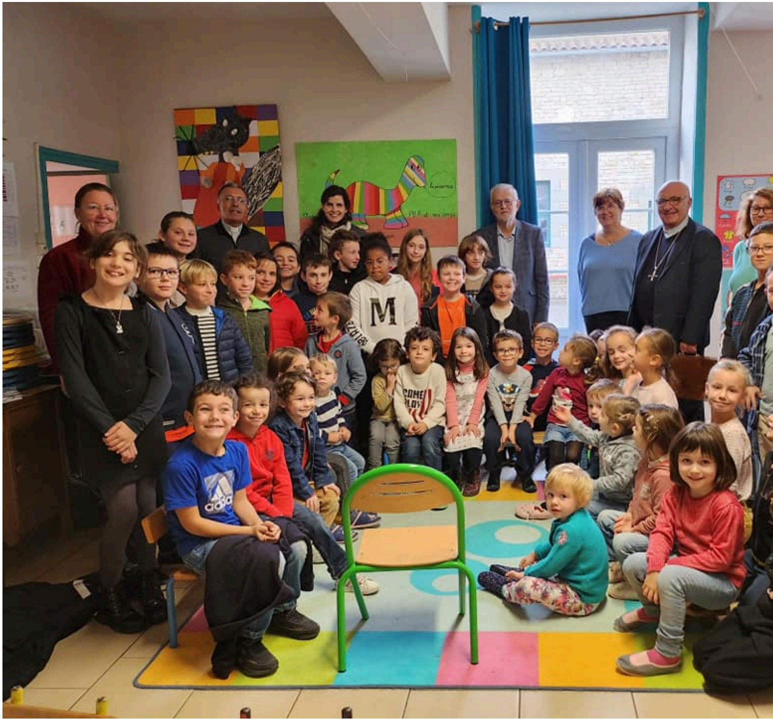
©2026 - Diocèse d'Angoulême - 13/04/2026 - https://charente.catholique.fr/nord-charente/actualites/retour-sur-la-visite-pastorale-en-nord-charente/