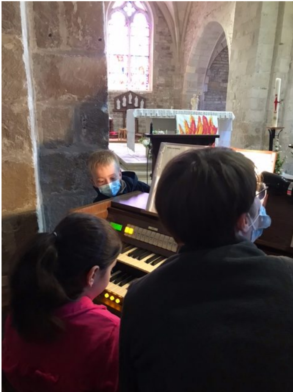
Nouvelle organiste !