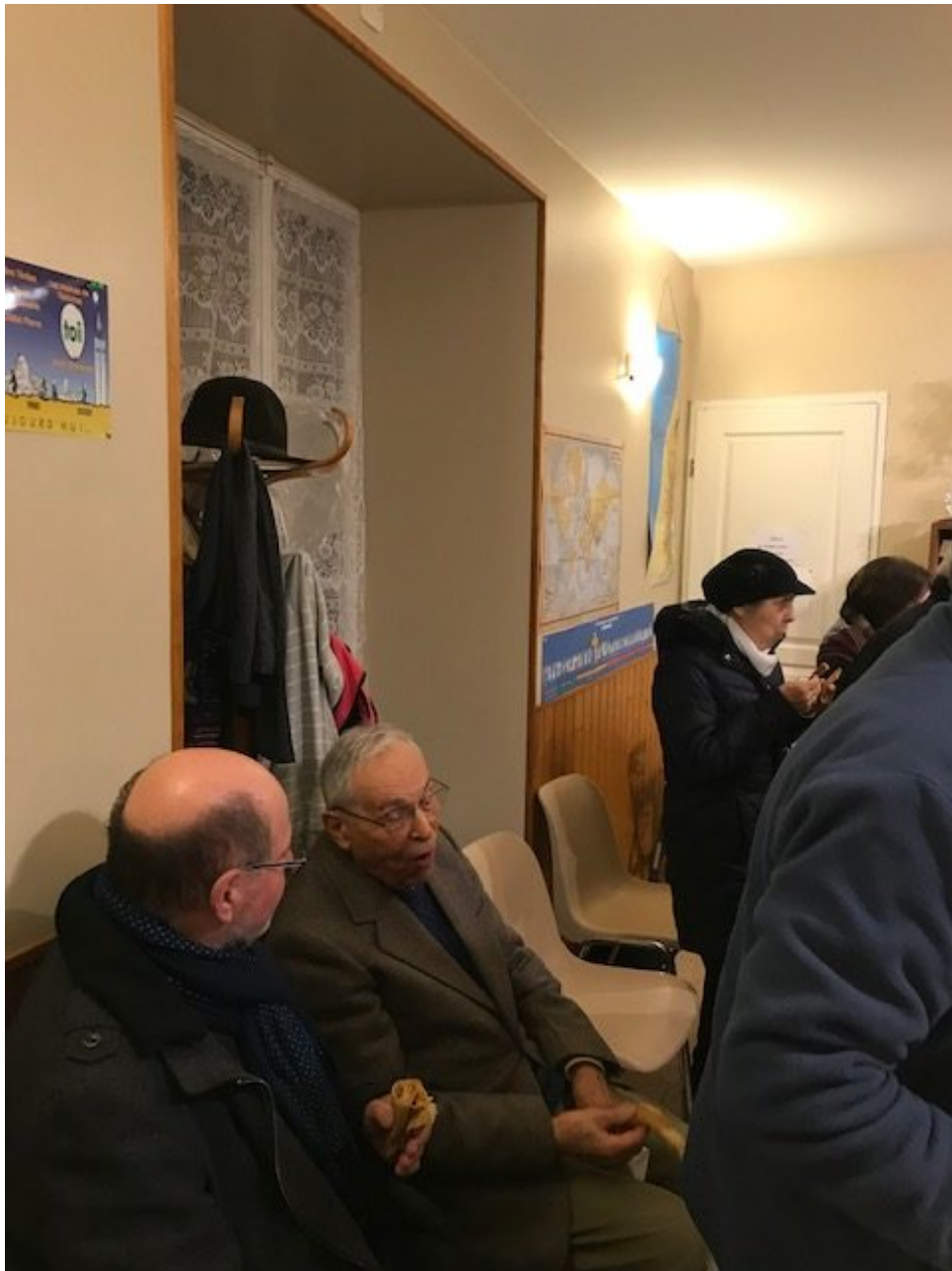
Un temps de convivialité