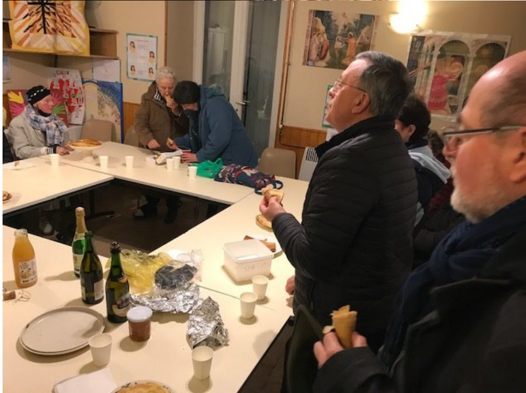
Temps fraternel au presbytère