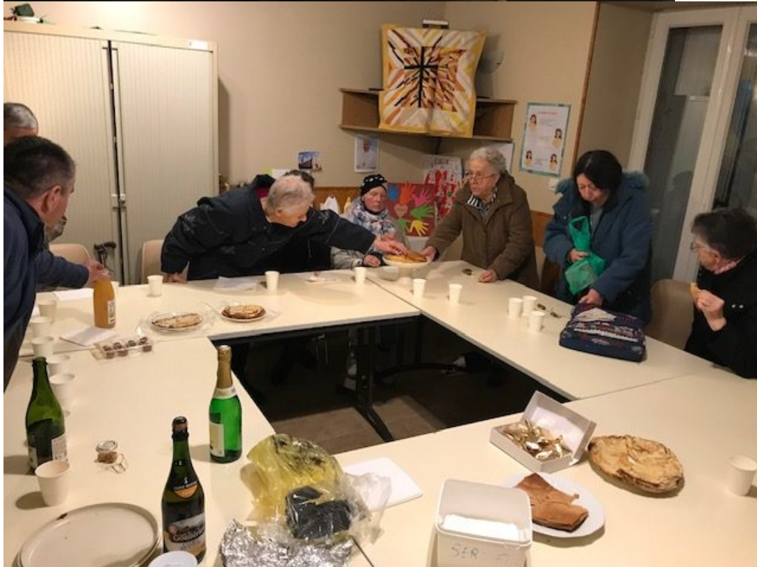
A l'heure des crêpes et du cidre !