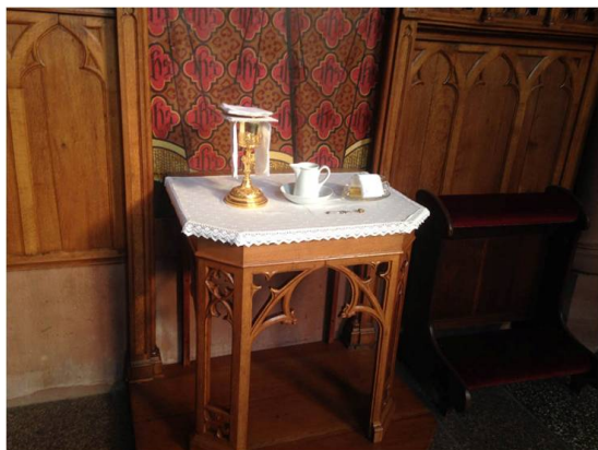
Petite table placée à proximité de l'autel

« Petite table placée à proximité de l'autel, la crédence est si simple que l'on oublierait presque combien elle est utile dans la liturgie.