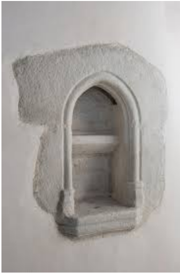
Crédence sous forme de niche

Au moment de la messe , la crédence est recouverte d'une nappe de lin retombant, en principe, jusqu'à terre sur tous les côtés. En dehors de la messe , la nappe est enlevée ou recouverte d'une sur-nappe. Jusqu'au XVIème siècle, les crédences se représentaient sous forme de niche creusées directement dans le mur d'une église, parfois munies d'une porte. Ce pouvait aussi être une armoire qui servait à cet usage. Il est encore possible de trouver des autels anciens entourés de deux crédences, formant, avec le tabernacle, un ensemble au style cohérent comme dans l'église de Saint – Lunaire en Ile-et-Vilaine. »