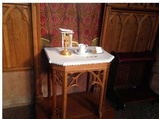
Petite table placée à proximité de l'autel

« Petite table placée à proximité de l'autel, la crédence est si simple que l'on oublierait presque combien elle est utile dans la liturgie.