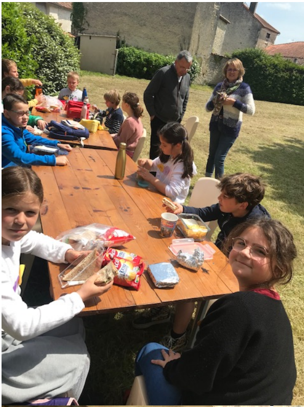
La pause attendue , le pique-nique !