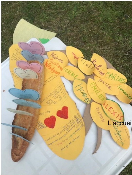
L'accueil avec les enfants de Aigre et leurs catéchistes