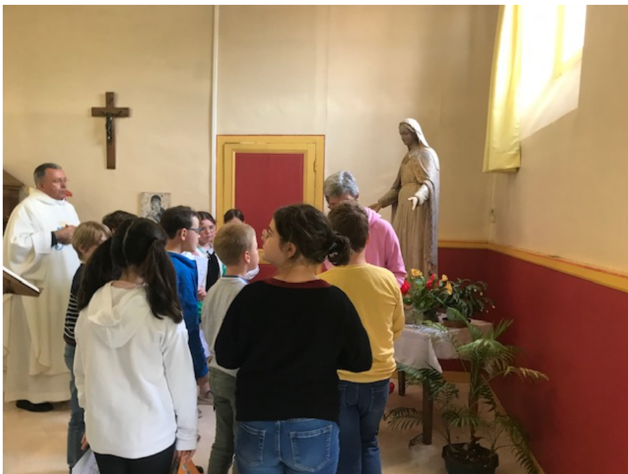
et aux plus grands !