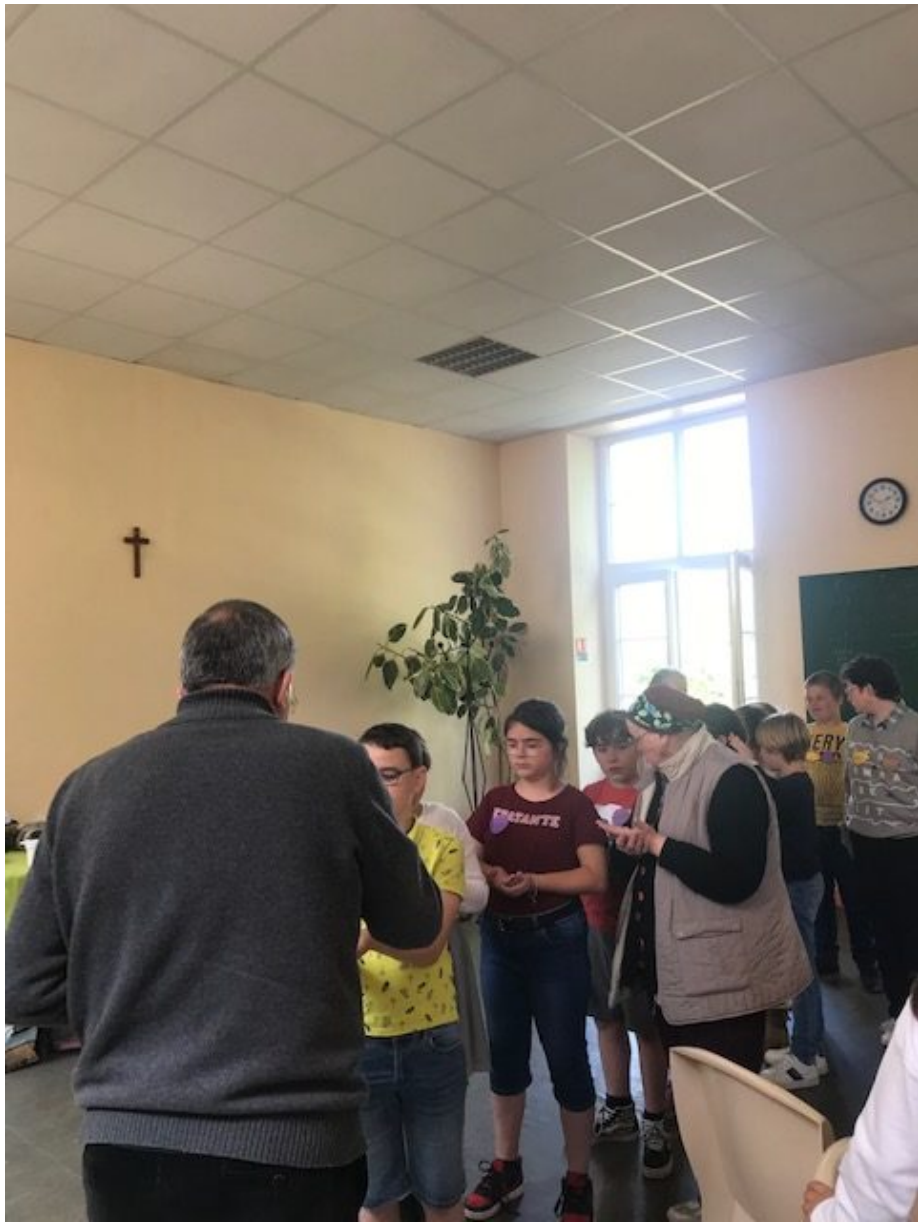
Un trône avec ses mains