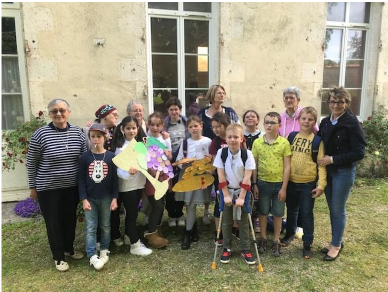
cette belle journée !