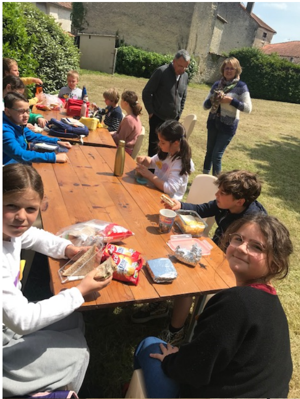
La pause attendue , le pique-nique !