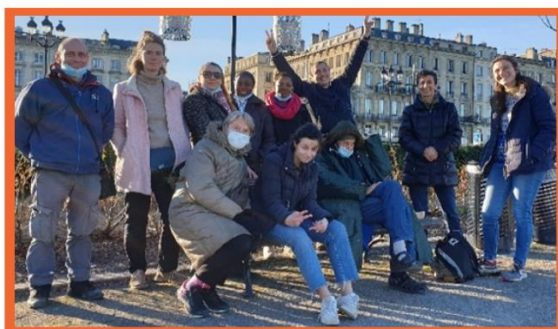
Les villageois ou "Les Vies la joie" de la maison Laudato Si