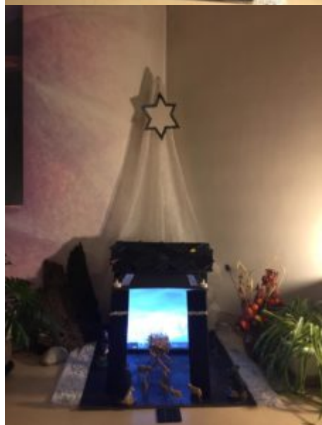
3ème dimanche de l'Avent