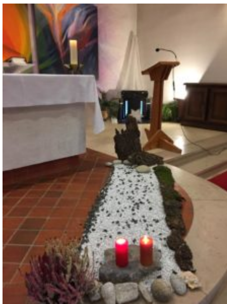
1er dimanche de l'Avent