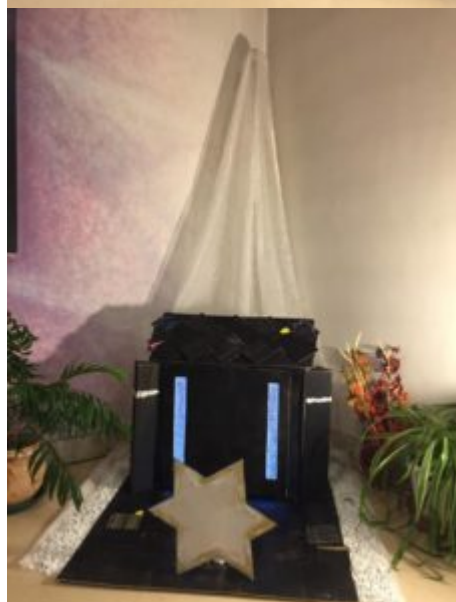
2ème dimanche de l'Avent