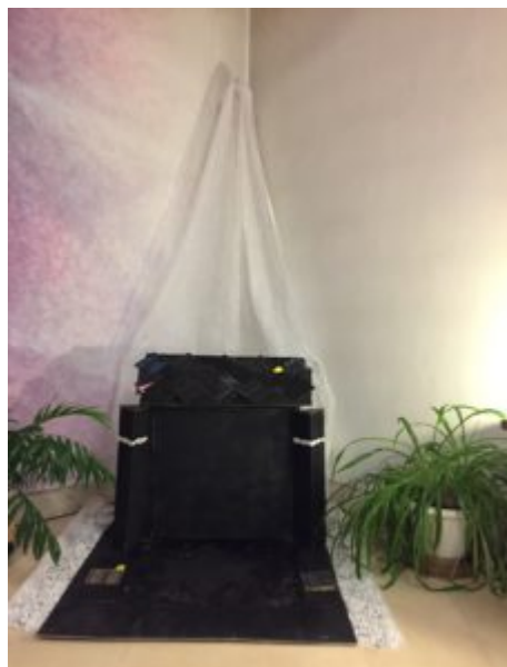
1er dimanche de l'Avent