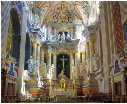
Lituanie, Kaunas ville