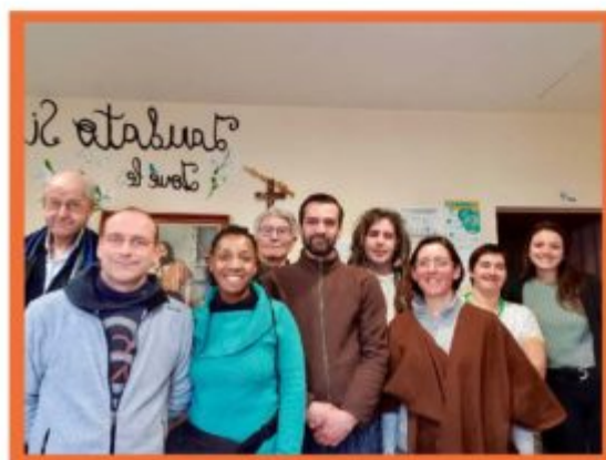
Les habitants de la maison Laudato Si