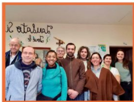
Les habitants de la maison Laudato Si