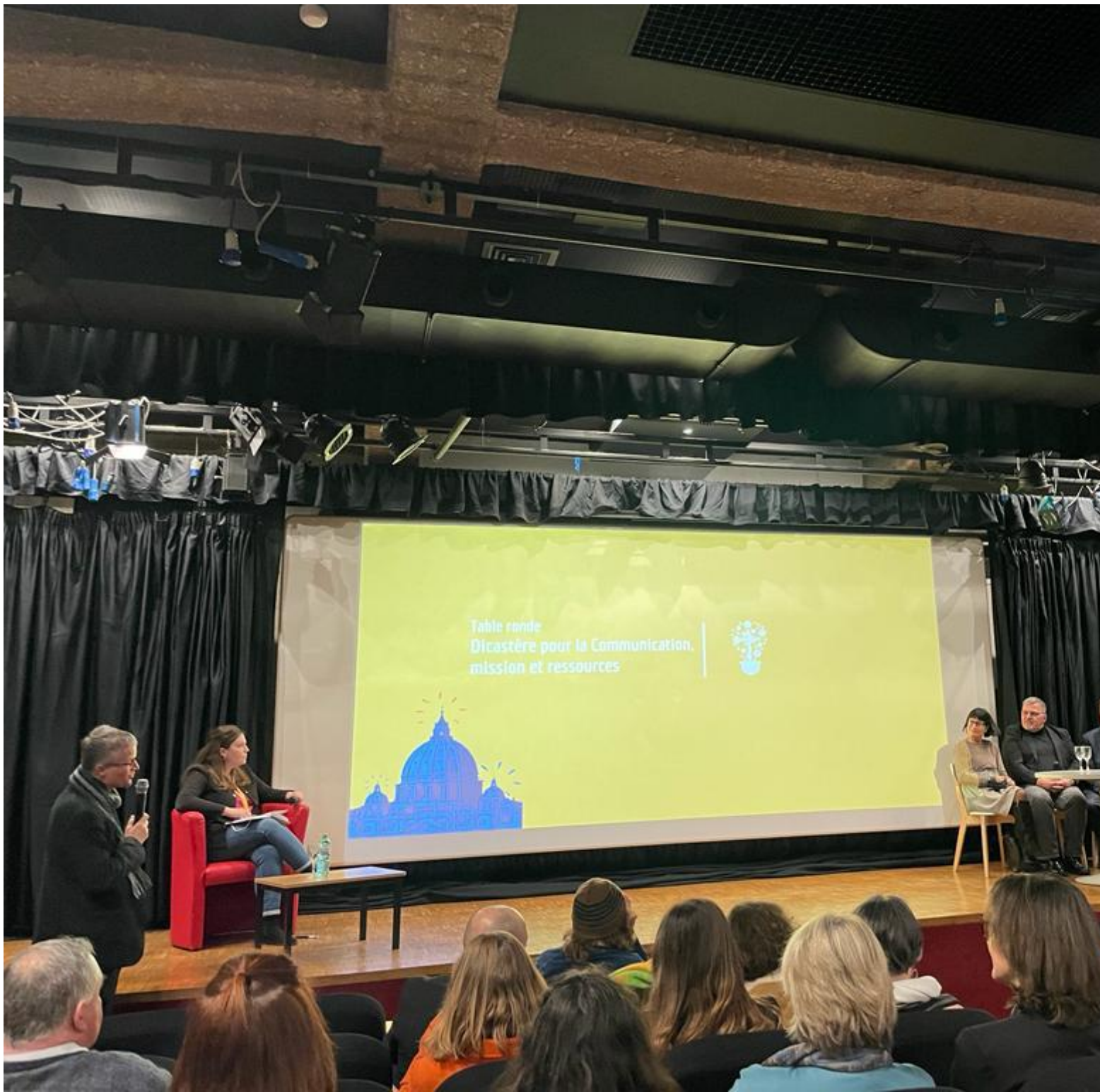
Table ronde Dicastère pour la Communication, mission et ressources