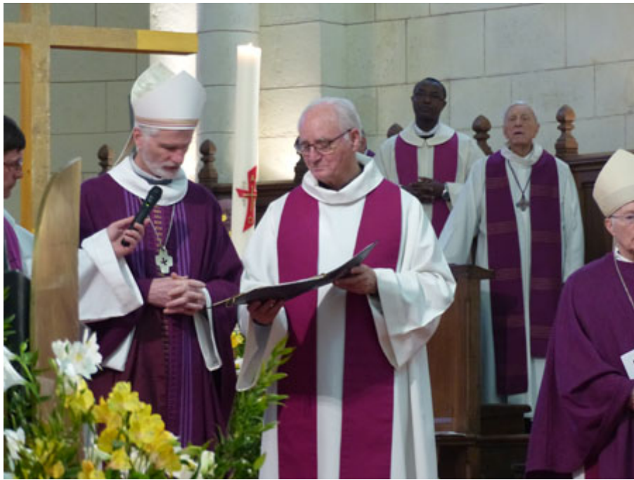
L'absoute a été prononcée par Mgr Jacques Blaquart

©2024 - Diocèse d'Angoulême - 17/07/2024 -